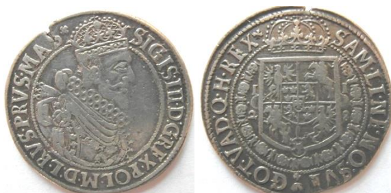
Moneta w zbiorach Muzeum Narodowego w Warszawie

Druga ciekawostka to ort z 1628 roku z mennicy Bydgoskiej bardziej przypominający półtalara niż orta i z tego względu nazywany jest też ćwierćtalarem. Waga 6,82g, średnica 30,0mm