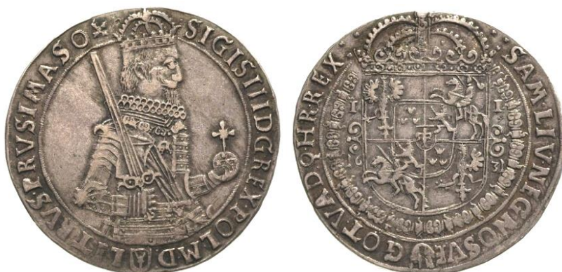
Wąska półpostać króla