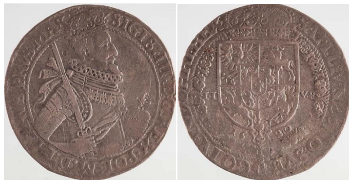
Moneta w zbiorach Muzeum Narodowego w Krakowie, zdjęcia wykonała Pracownia Fotograficzna Muzeum Narodowego w Krakowie