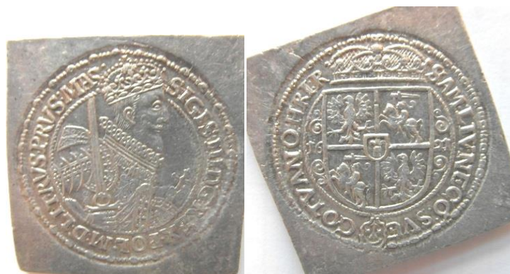
Moneta w zbiorach Muzeum Narodowego w Warszawie

A nasz katalog chciałbym zacząć od 2 ciekawostek które często nie są ilustrowane nawet w katalogach specjalistycznych. Pierwsza to odbity w formie klipy ort 1621.