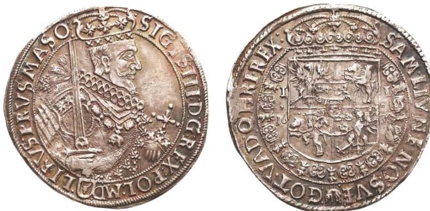
Szeroka półpostać króla