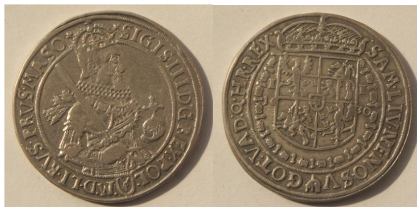
Wąska półpostać króla